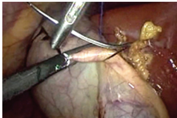
FIGURA 3: COLEDOCOTOMÍA Y EXTRACCIÓN DEL PARÁSITO