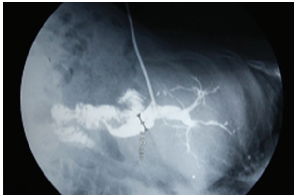
FIGURA 6: COLANGIOGRAFÍA POSTOPERATORIA A TRAVÉS DE TUBO EN T

En la presente serie de casos la resolución laparoscópica se realizó con éxito. En dos casos el tiempo de estadía se prolongó a 7 o 10 días por complicaciones de Fístula. En los otros 7 casos se realizó una colecistectomía laparoscópica, con exploración de la vía biliar común con extracción del parásito y colocación de un tubo en T sin complicaciones con un tiempo de hospitalización en la mayoría de casos de 4 días. La relación de los casos con respecto a sexo fue más prevalente en mujeres con una relación de 8:1.